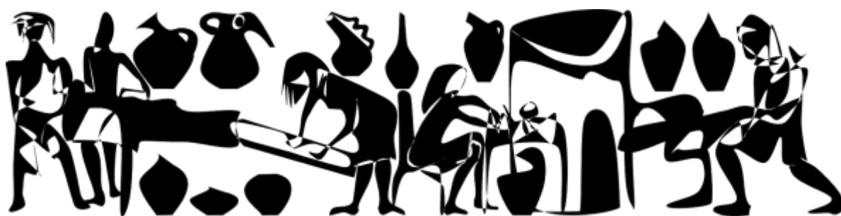
Figura 13 - Atelier Vila Barroló. Gravura de Antônio Cleofas ilustrando o cotidiano do atelier.

Assim entende o pesquisador de performance Richard Schechner (2003) ao recordar que o aprendizado se dá através do treino, do esforço e da repetição na vida diária. Conforme observa o autor, na vida em sociedade – bem como na elaboração de um espetáculo teatral, por exemplo – são exigidos níveis específicos de preparação e ensaio. No caso da espécie humana, há a necessidade em realizar um extenso aprendizado desde a infância, passando pela adolescência, até alcançar um bom desempenho na vida adulta. Falar, comer, caminhar, como se portar, são ações básicas, mas que, no entanto, demandam anos de ensaio e repetição. Uma sequência de palavras ou a realização de ações previamente aprendidas trazem em si diferentes níveis de representatividade e repetição daquilo o que foi incorporado ao longo dos anos.