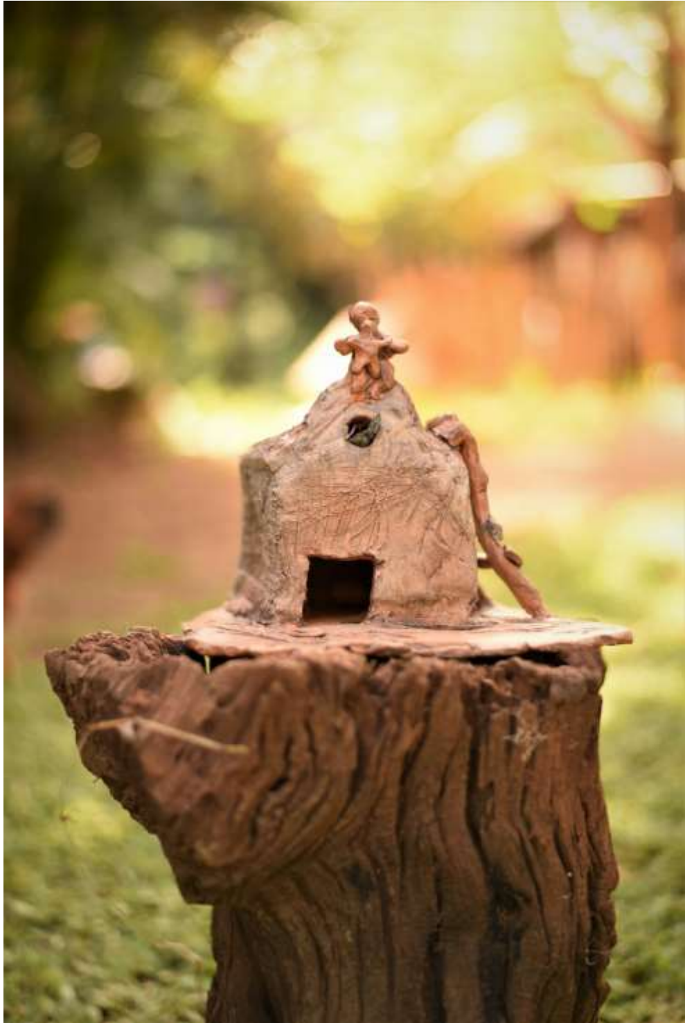
Figura 17 – Peça de Rava Bezerra Pinheiro, neta de Antônio Cleofas.