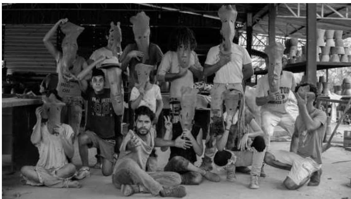
Figura 14 - No Atelier.

Desse modo a Vila Barroló se tornou uma iniciativa que desenvolve e articula atividades culturais diversas em sua região, contribuindo para o acesso, a proteção e a promoção dos direitos, da cidadania e da diversidade cultural no Brasil. A liberdade de envolvimento com o conhecimento dentro da comunidade, que produz um conjunto de dados pessoais de diferentes prismas, dão corpo à uma espécie de caldo cultural diverso e profuso. Disso decorre que, mesmo tendo os 15 filhos nascidos com as mesmas condições de educação, contexto social e econômico, a mesma trajetória, com experiências vivenciadas conjuntamente, a relação particular com o saber será distinta, dando forma a diferentes modos de comportar e de internalizar o mundo à sua volta.