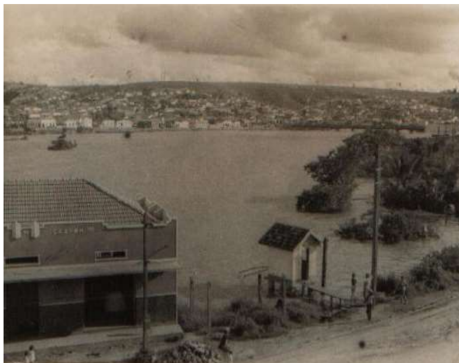
Figura 6 - Rio Mucuri, local onde o barro era antigamente colhido pelos tradicionais ceramistas da cidade de Nanuque/MG.

Depois desse encontro em torno d'água, sua realidade da terra seca – condição dos primeiros anos – foi se transformando. Do rio, colheu-se o barro, primeira tarefa no processo conduzido por um artesão. A junção entre terra e água fez nascer uma massa volúvel e moldável. A argila é a matéria-prima do ser, que molda também a si mesmo através da escuta de sua criatividade. Essa relação poética entre a terra seca e a água foi notada pela pesquisadora em Psicologia, Thais Wense de Mendonça Cruz que, em sua pesquisa doutoral na USP chamada, À Escuta do Fazer , refere-se aos aspectos da personalidade e da história de Cleofas, escrevendo que o ele: