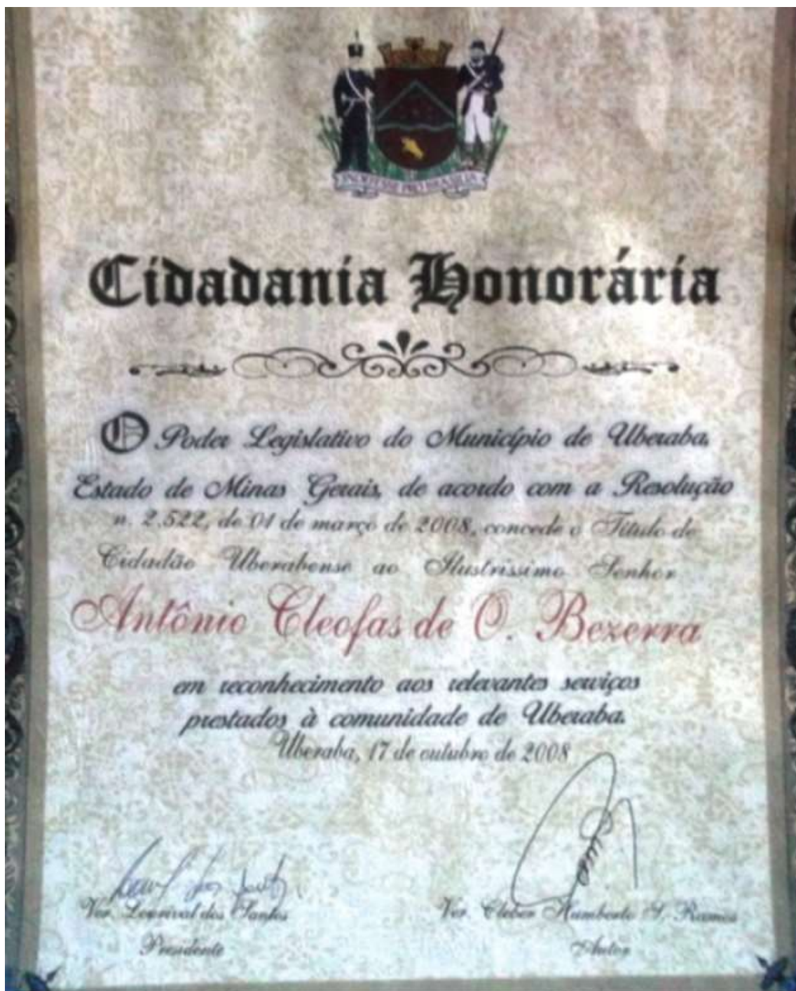
Figura 9 - Título de Cidadania Honorária à Cleofas em reconhecimento aos relevantes serviços prestados à comunidade de Uberaba como artesão de barro.